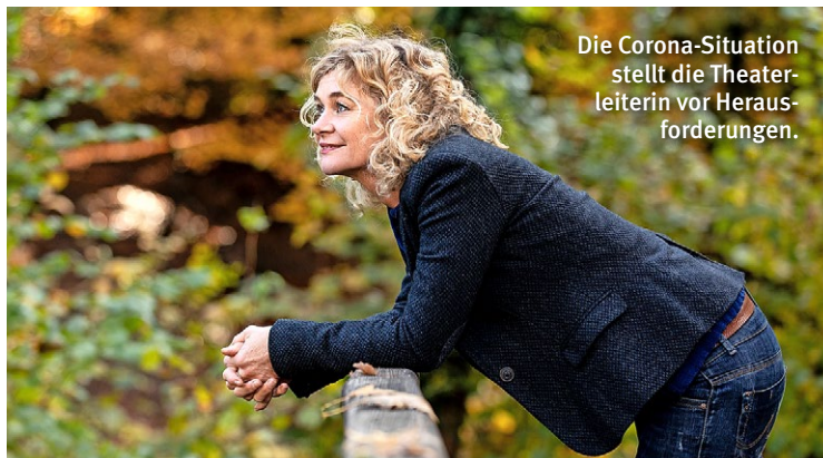
Die Corona-Situation stellt die Theaterleiterin vor Herausforderungen.

Rhea und Lou hatten immer ein sehr enges Verhältnis zur Mutter, selbst früher in der Pubertät. «Wir konnten ihr alles erzählen», sagen